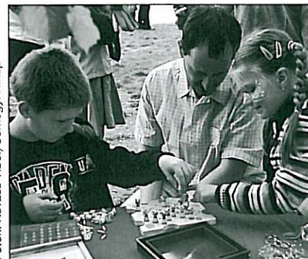
Voltak akik társasjátékot játszottak

kipásztor köszöntő szavait követően megérkezett meglepetés ajándékunk az óriási születésnap torta.