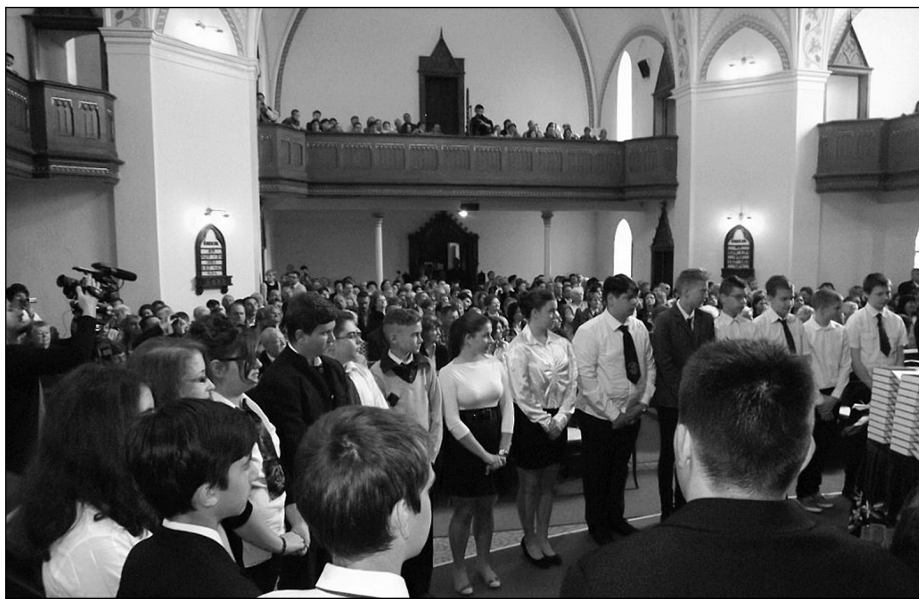
Templomunkban sokan tanúi voltak a diákok ünnepélyes fogadalomtételének