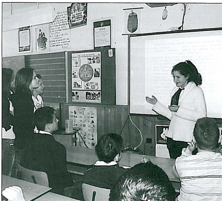
A digitális tábla adta előnyöket szertik alkalmazni a lorántffy diákok