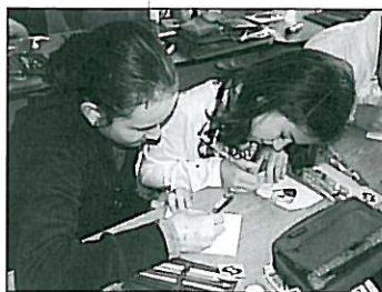
Készülnek a rajzok